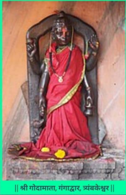
॥ श्री गोदामाता, गंगाद्वार, त्र्यंबकेश्वर ॥

चढती रज तम, झिजती शम दम पाहुनी गौतममुनी ग । कळवळला मनि बसला जाउनी उग्र तपालागुनी ग । प्रसन्न करूनी गिरिजाशंकर आणी तुज महीवरी ग । उचलुनि घे मज पदरी अंबे गंगे गोदावरी ग ॥१॥